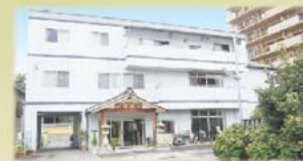
東区 養寿院ホール