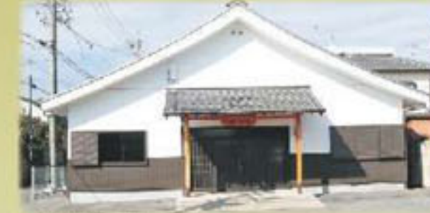
北区 修善寺ホール