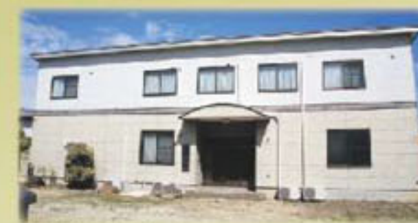
北区 聖徳寺ホール