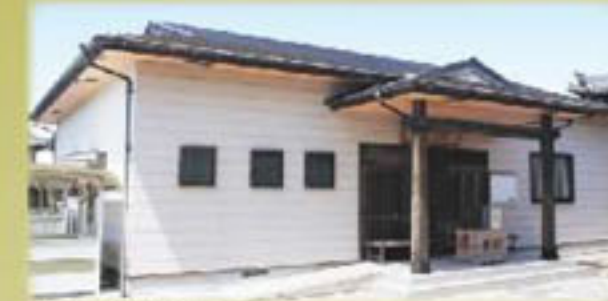
西区 光通寺ホール